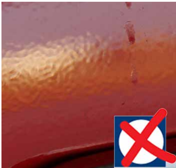
Slechte lakherstelling, sinaasappelpatroon en lopers.