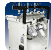
Tête à Percer perçage parfait

Table complète des données techniques à page 7