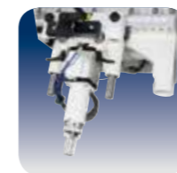
Système de Nettoyage propreté surprenante