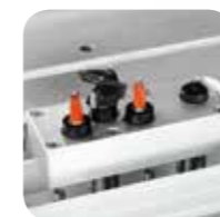
Groupe pour Charnières accessoires de haute technologie