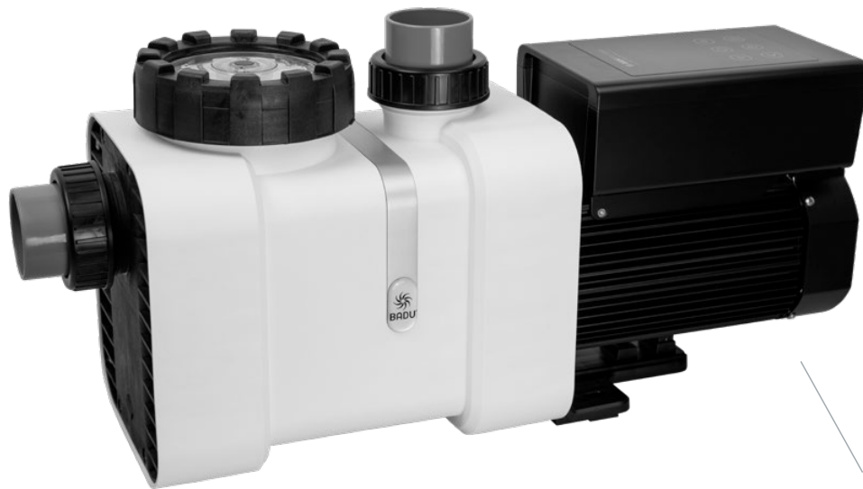
Lüfterrad mit Lüfterhaube > Reduzierte Betriebsgeräusche