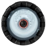
Klarsichtdeckel mit integrierter LED-Beleuchtung