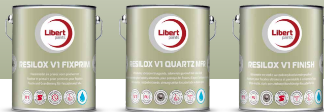
Resilox V1 Fixprim