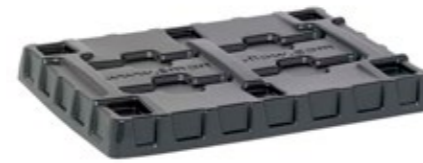
SF 600 CTW