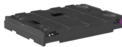
SF 600 CD