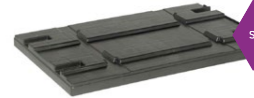
SF 800 CP