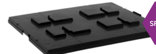
SF 1000 CP