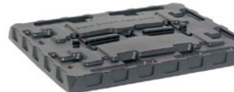
SF 1000 CTW