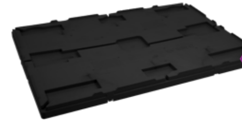
SF 800 CA