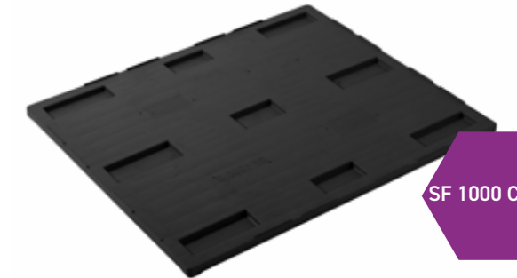
SF 1000 CBNM