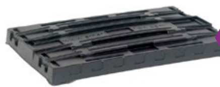
SF 800 CTW